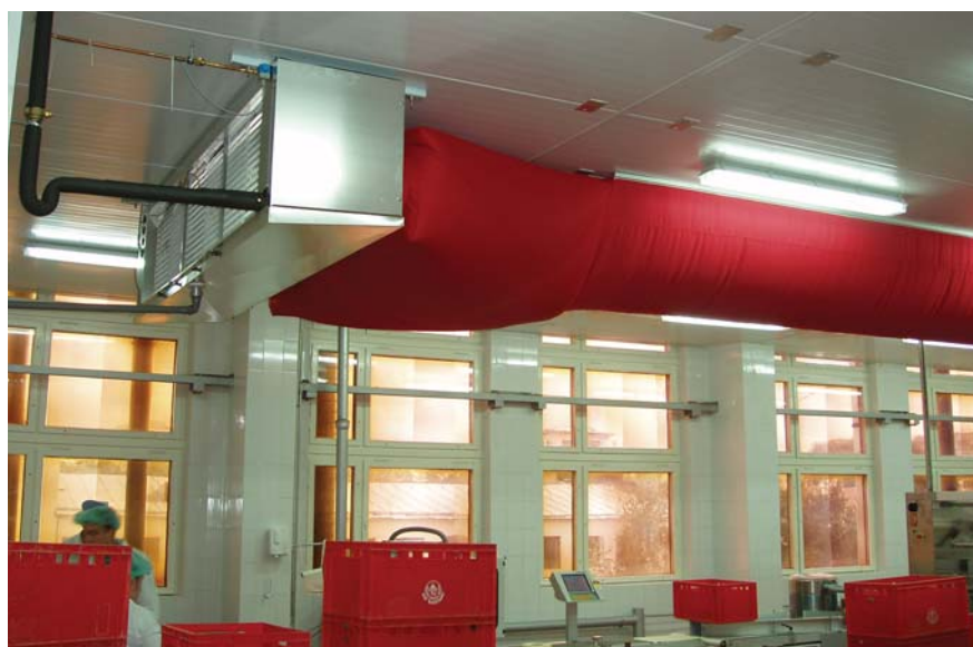
Рис.1. Колбасный комбинат «Богатырь» (г. Москва)

– Используется 100% искусственной ткани, чтобы они выдержали в сложной среде: повышенная влажность, пониженные температуры