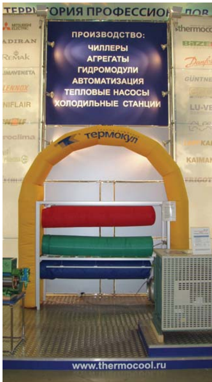
Рис. 3. Выставка «Мир Климата – 2005»

воздуховоды предлагаемой конструкции. В общем виде методика расчета является аналогичной методике расчета производственных систем воздухораспределения с использованием других распределительных устройств и отличается в определении расхода воздуха, необходимого для погашения теплоизбытков, и расхода воздуха, необходимого для создания заданной скорости в рабочей зоне помещений.