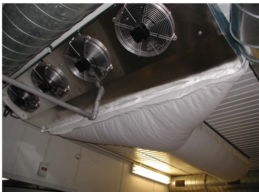
Рис. 2. Мясокомбинат «Снежана» (г. Москва)